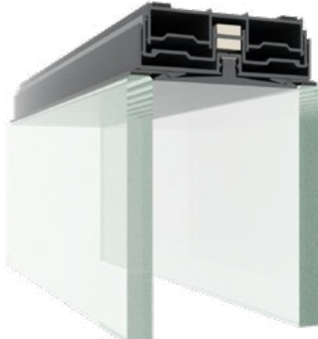
Profilé de plafond télescopique