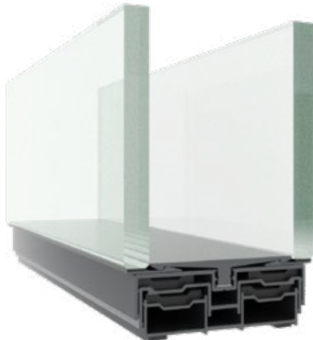
Profilé de sol télescopique