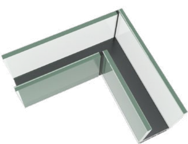
Raccordement ouvert d'angle en verre