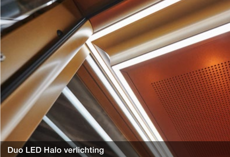
Duo LED Halo verlichting