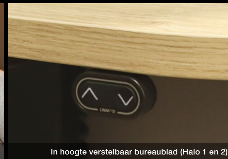
In hoogte verstelbaar bureaublad (Halo 1 en 2)*